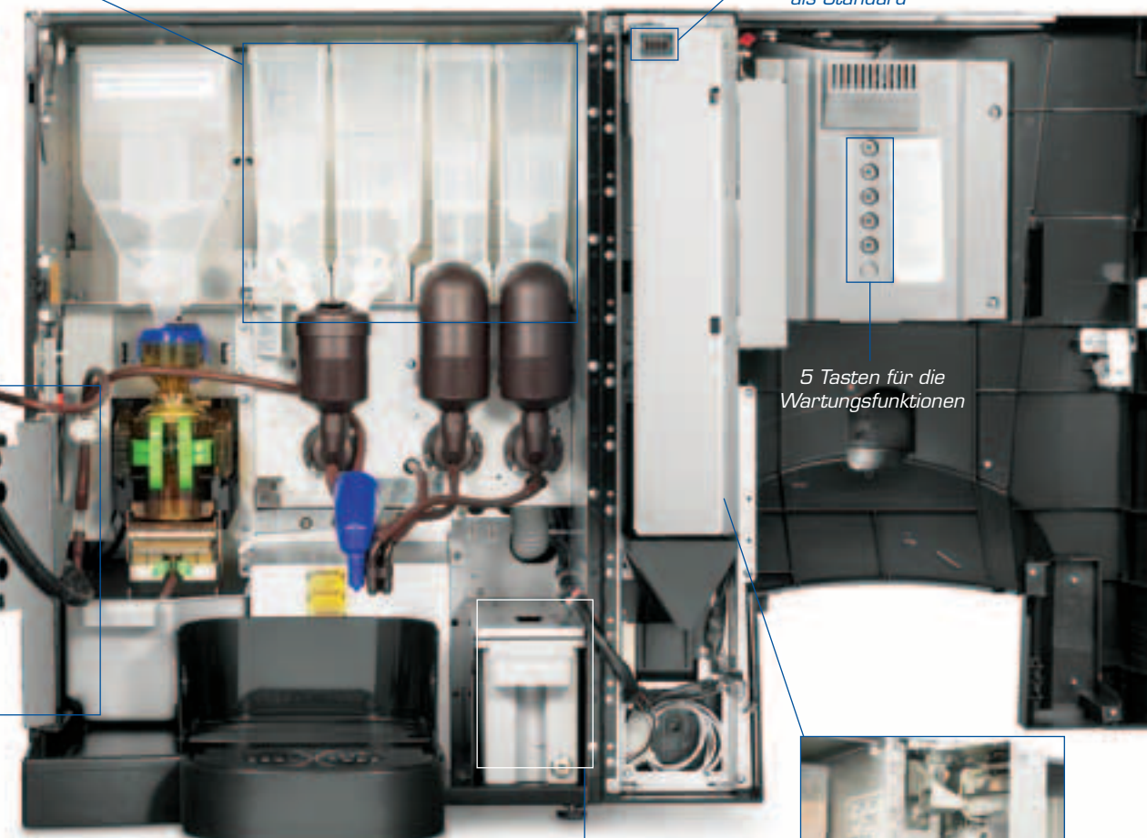
5 Tasten für die Wartungsfunktionen