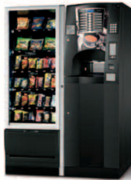
Kombinationsmöglichkeiten mit Snakky und Snakky SL